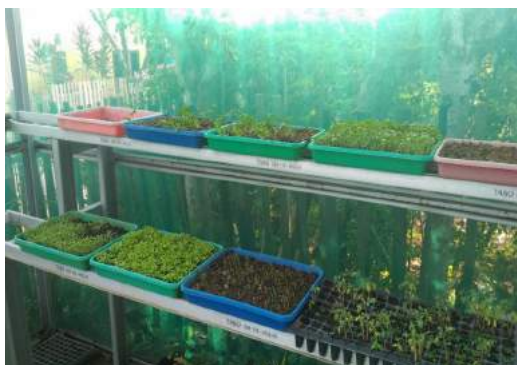
Gambar 3 Contoh rak bibit dan tempat penyemaian