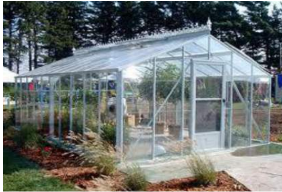
Gambar 2 Contoh Bangunan Rumah Bibit

Kebun bibit merupakan salah satu sumber bibit dalam pengembangan KRPL, sebagai upaya menuju terciptanya Rumah Pangan Lestari (RPL). RPL yang dimaksud adalah rumah tangga atau tempat tinggal/pondok pesantren/asrama/rusun yang memanfaatkan pekarangan secara optimal melalui model KRPL untuk memenuhi kebutuhan pangan dan gizi sehari-hari, serta menambah pendapatan keluarga. Untuk keberlanjutan KRPL dan keuntungan ekonomi bagi kelompok, sebagian bibit hasil dari kebun bibit dapat dijual kepada masyarakat lainnya.