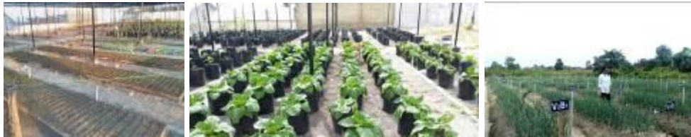
Gambar 7. Kegiatan pemanfaatan Kebun Percobaan (KP) Kubang

Kegiatan dilaksanakan di lahan Kebun Percobaan BPTP Riau Desa Kubang Jaya, Kecamatan Siak Hulu, Kabupaten Kampar.