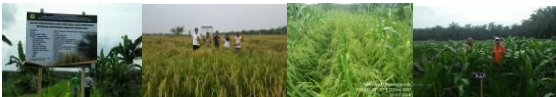
Gambar 23. Largo, peningkatan IP dan Tumpang sari tanaman kegiatan Upsus

Hasil pengamatan demplot Jarwo Super menghasilkan produksi padi sawah sebanyak 11 ton/ha di Rokan Hilir, 8 ton/ha di Kabupaten Kampar dan Indragiri Hilir, untuk Largo super memperoleh hasil sebanyak 3,25 ton/ha sampai dengan 3,90 ton/ha. Sedangkan kegiatan turiman dengan kedelai dan jagung masih dalam pertumbuhan generatif.