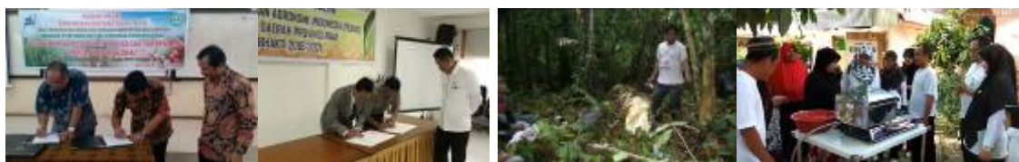
Gambar 43. Penandatanganan MoU dengan UN dan UIN Suska Riau, survey kesesuaian lahan serta pendampingan pengolahan cabai

Kerjasama dengan Universitas Riau dan UIN Suska Riau dimulai dengan penandatanganan MoU pada tahun 2018, sedangkan dengan Universitas Islam Riau (UIR) dalam bentuk tindak lanjut MoU yang telah ditandatangani pada tahun 2015-2019. Selain itu kegiatan kerjasama juga dilaksanakan dengan stakeholder yaitu dengan PT. Uniseraya dalam bentuk survey kesesuaian lahan serta kerjasama dengan Kelompok Tani Mawar di Kecamatan Tambang, Kabupaten Kampar dalam bentuk pendampingan pengolahan cabai.