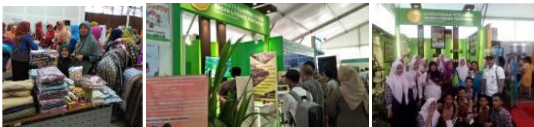
Gambar 18. Pameran yang diikuti BPTP Riau

Selain pameran untuk mendiseminasikan hasil litkaji BPTP Riau juga telah memproduksi 13 video dengan judul sbb: