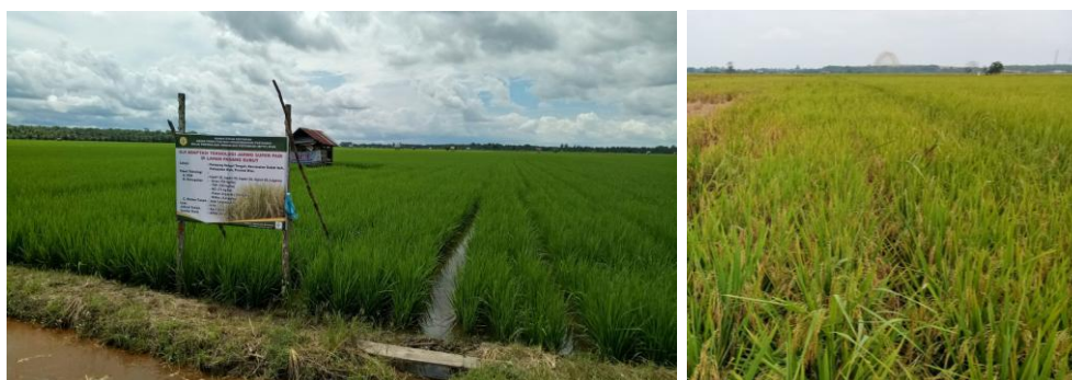
Gambar 13. Performa tanaman di lapangan