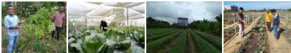
Gambar 3. Kegiatan Pemanfaatan biopestisida akar tuba di Kab. Kampar

Kegiatan pengkajian dilaksanakan di Desa Kualu, Kecamatan Tambang dan Kebun Percobaan Kubang Jaya, Kec. Siak Hulu Kabupaten Kampar