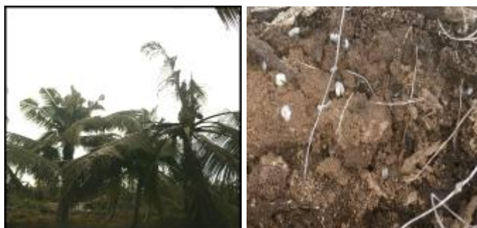
Gambar 19. Tanaman kelapa terserang hama kumbang dan Larva kumbang kelapa

Kegiatan dilaksanakan di Parit Biuku Desa Pebenaan, Kecamatan Keritang, Kabupaten Indragiri Hilir, Riau. Agroekosistem lahan pasang surut, melibatkan 1 Kelompok tani dengan jumlah anggotanya 20 orang. Metode pendampingan yaitu dengan demplot pengendalian hama kumbang menggunakan ferotrap (feromon + trap) dan pemupukan spesifik lokasi yaitu dengan menggunakan pupuk NPK, terusi dan garam.