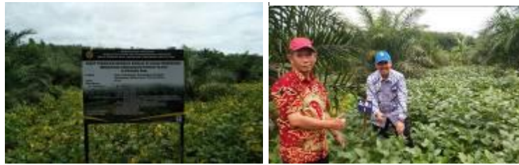
Gambar 6. Kegiatan Pengkajian Paket Teknologi Budidaya Kedelai di Kabupaten Rokan Hulu

Kegiatan dilaksanakan di Desa Sukamaju, Kecamatan Rambah, Kabupaten Rokan Hulu.