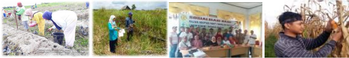
Gambar 17. Penanaman, ploting, sosialisasi dan panen jagung