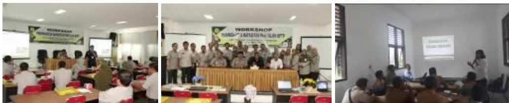
Gambar 36. Kegiatan peningkatan kapasitas penyuluh BPTP