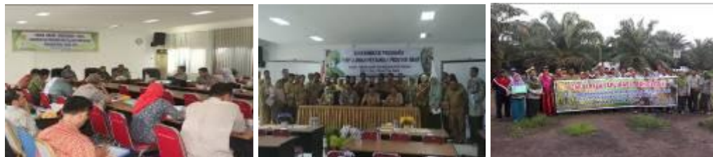
Gambar 38. Kegiatan FGD, sinkronisasi program penyuluhan dan Temu Aplikasi Teknologi

Kegiatan yang telah dilaksanakan yaitu Focus Group Discussion FGD antara BPTP Riau dengan Dinas Pertanian TPHBun Provinsi Riau, sinkronisasi program penyuluhan pertanian Provinsi Riau dan kegiatan temu aplikasi teknologi di Kabupaten Bengkalis serta publikasi buku rekomendasi teknologi largo dan jarwo super yang dilaksanakan di Kecamatan Rupert, Kabupaten Bengkalis, BPP Rambah Samo Kabupaten Rokan Hulu dan BPP Tapung, Kabupaten Kampar.