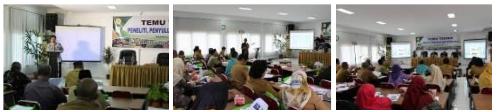
Gambar 34. Temu teknis di Kota Pekanbaru

Temu Teknis pertama dilaksanakan di Balai Pengkajian Teknologi Pertanian (BPTP) Riau yang diikuti oleh 60 orang peserta yang berasal dari perguruan tinggi, penyuluh BPTP, penyuluh provinsi, penyuluh kabupaten, widyaiswara, KTNA Provinsi dan KTNA Kabupaten.