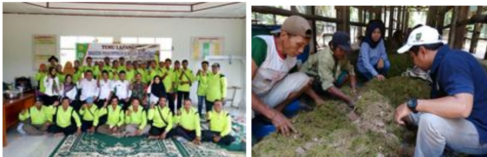
Gambar 20. Temu lapang dan pembuatan pakan komplit kegiatan pendampingan kawasan peternakan