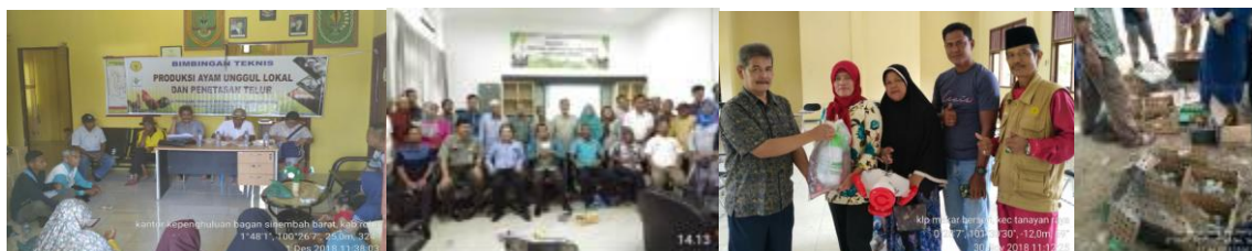
Gambar 25. kegiatan bimtek dan penyerahan sarana produksi pembibitan ayam

Unggul Lokal dan Manajemen Penetasan Telur, dan 4). Bimtek "Teknologi Produksi Ayam Unggul Lokal dan Manajemen Penetasan Telur