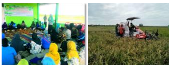
Gambar 40. Bimtek teknologi jarwo super dan panen di lokasi demplot

Dari hasil ubinan diperoleh provitas 3,6 ton/hektar, sedangkan provitas eksisting adalah 3,2 ton/ha pada penanaman dengan IP 100. Permasalahan yang dihadapi adalah adanya serangan burung yang massif. Hal ini karena pertanaman padi seluas 50 ha disekitar lokasi demfarm gagal panen sehingga serangan burung terkonsentrasi di demfarm. Gagal panen disebabkan karena varietas eksisting yaitu Logawa tidak tahan intrusi air laut pada musim kering.