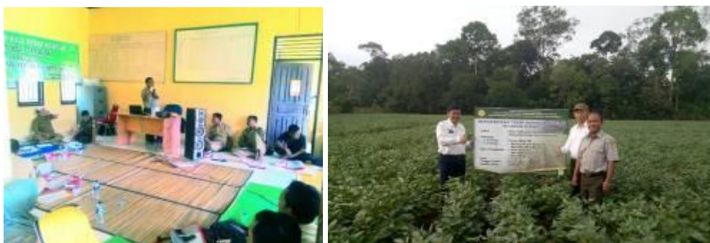
Gambar 39. Bimtek Kedelai dan Performa demplot tanaman kedelai di Kabupaten Rokan Hulu

Varietas kedelai yang ditanam adalah Devon-1 yang toleran terhadap kekeringan, hal ini terbukti meskipun sejak tanam hingga panen hanya sedikit mendapatkan curah hujan, tanaman tetap menghasilkan polong dan menghasilkan biji cukup baik. Petani sangat tertarik untuk mengembangkan kedelai ini.