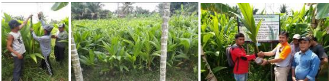
Gambar 45. Kegiatan perbibitan kelapa

Bibit yang diserahkan sebanyak 4500 batang dari 5500 benih. Kelompok Tani penerima sesuai dengan CPCL yaitu Kelompok Tani Usaha Manunggal Desa Pengalihan Kecamatan Enok sebanyak 2000 batang dan Kelompok Tani Medan Jaya Desa Sungai Rukam Kecamatan Enok sebanyak 2500 batang.