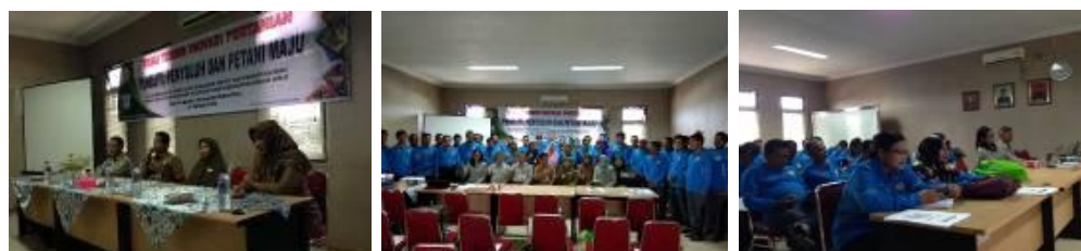
Gambar 35. Temu teknis di Kabupaten Rokan Hulu

Temu teknis kedua dilaksanakan di Dinas Tanaman Pangan dan Hortikultura Kab. Rokan Hulu. Peserta berjumlah 40 orang yang terdiri dari penyuluh dan koordinator penyuluh dari 10 UPTD dan 1 BBU, petani dan Peternak di Kab. Rokan Hulu