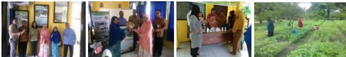
Gambar 42. Kegiatan display inovasi pertanian di BPP Kuok

Disamping itu juga dibuat demplot budidaya kedelai diantara tanaman jeruk di halaman BPP Kuok seluas 0,5 ha. VUB kedelai yang ditanam adalah Dena dan Anjasmoro. Selain itu guna meningkatkan pengetahuan penyuluh, dilaksanakan bimtek teknologi budidaya kedelai di lahan kering kepada Penyuluh Wilayah Kerja BPP Kuok.