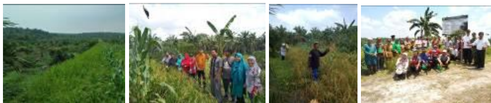
Gambar 4. Kegiatan pengkajian Pengembangan Largo Super di Kab. Siak

Kegiatan pengkajian dilaksanakan di Desa Teluk Merbau, Kecamatan Dayun, Kabupaten Siak.