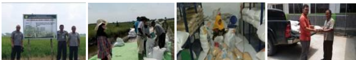
Gambar 44. Kegiatan Perbenihan Padi