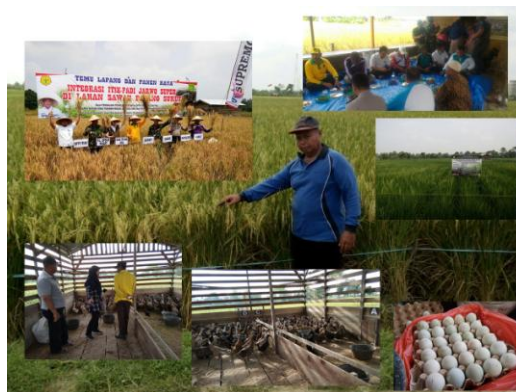
Gambar 14. Kegiatan Integrasi Itik-Padi Jarwo Super

Berdasarkan hasil kajian diperoleh hasil bahwa teknologi integrasi Jarwo Super padi memberikan produksi padi tertinggi sekitar 6.50 ton/ha bila dibandingkan dengan teknologi lainnya. Selain produksi padi yang cukup tinggi, petani kooperator juga mendapatkan tambahan hasil yang dapat dipanen berupa telur itik sekitar 90 butir/hari pada saat puncak produksi, serta tambahan pendapatan melalui penjualan telur itik.