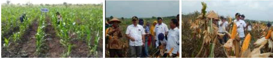
Gambar 5. Kegiatan pengembangan sistem usahatani jagung pada lahan pasang surut di Kab. Siak