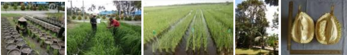
Gambar 31. Kegiatan SDG

Agar memudahkan dalam proses karakterisasi dan upaya pelestariannya dilakukan penyusunan katalog tanaman buah varietas lokal yang berada di kebun plasma nutfah kabupaten Pelalawan. Data meliputi informasi kelengkapan morfologi yang telah dikarakterisasi dan dokumentasi bagian tersebut.