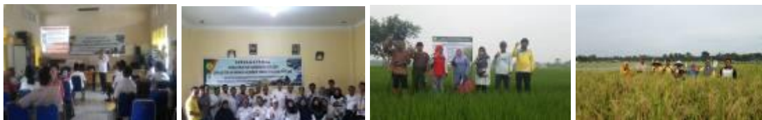
Gambar 33. Kegiatan Pengembangan Pola Tanam Mendukung Peningkatan Indeks Pertanaman

Pengembangan pola tanam tanaman pangan mendukung peningkatan IP pada agroekosistem lahan hujan dilakukan secara partisipatif bersama petani. Teknologi yang diintroduksi yakni Teknologi Jarwo Super 2: 1. Lokasi kegiatan berada pada tiga Lokasi yakni Kelompok Tani Sumber Rezeki, Dusun Tua Kecamatan Kelayang, Kabupaten Indragiri Hulu, varietas yang ditanam adalah Logawa dengan kelas benih pokok (SS), seluas 1 ha. Pemupukan 150 urea + 100 TSP + 100 KCl kg/ha. Rata2 hasil panen 5,10 ton / ha. Lokasi kedua yaitu Kelompok Tani Teluk Sejuah, Kecamatan Kelayang, Kabupaten Indragiri Hulu varietas yang ditanam adalah Inpari 34 dengan kelas benih sebar (ES), seluas 1 ha. Pemupukan 150 urea + 100 TSP + 100 KCl kg/ha. Rata2 hasil panen 5,20 ton / ha. Lokasi ketiga Kelompok Tani Rukun Tani 1, Desa Kuala Mulya, Kecamatan Kuala Cenaku Kabupaten Indragiri Hulu. Varietas yang ditanam adalah Inpara 5 dengan kelas benih Dasar (FS), seluas 1 ha. Saat ini pada fase primordia, atau keluar malai.