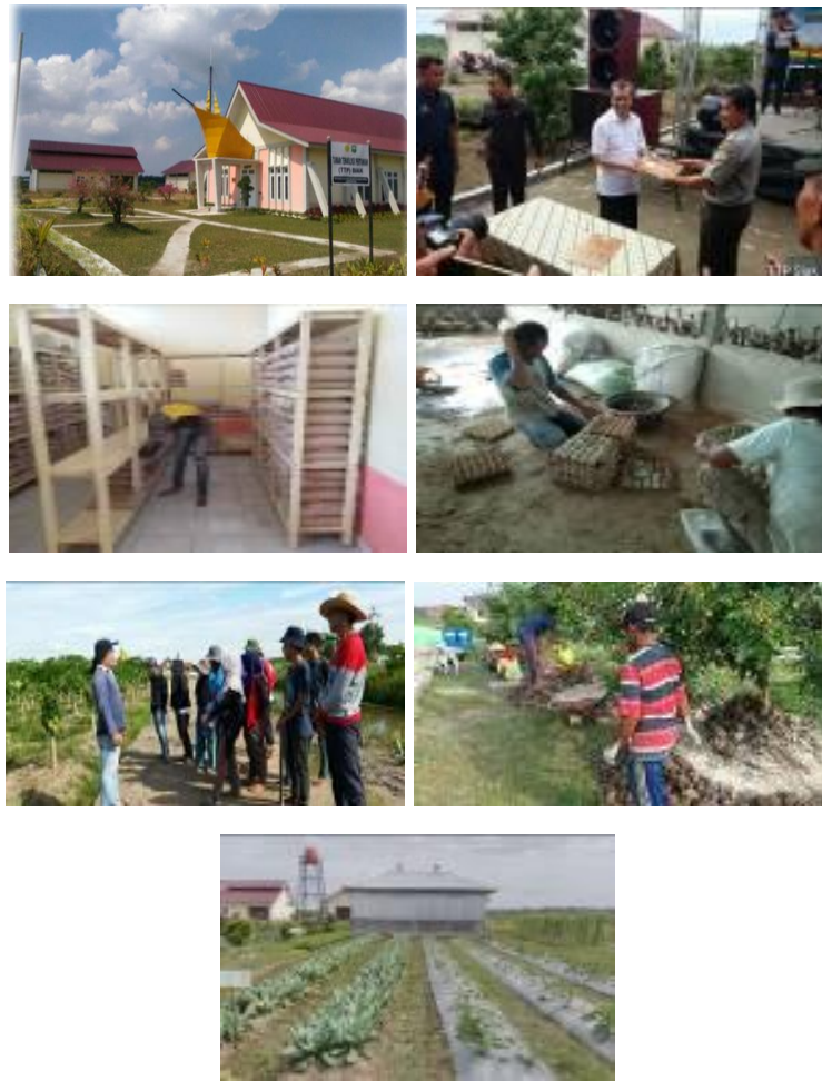
Gambar 30. Kegiatan di TTP Siak