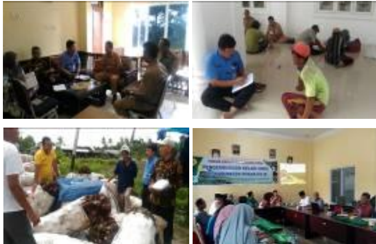
Gambar 28. Kegiatan rekomendasi kebijakan pembangunan pertanian di Kabupaten Rokan Hilir