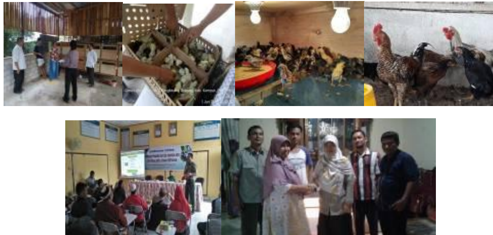
Gambar 26. Kegiatan Unit Inti Plasma Pembibitan Ayam Skala Rumah Tangga di Kabupaten Kampar

Peternak inti telah menghasilkan DOC SenKUB dari 250 ekor induk KUB dan 50 ekor pejantan Sensi dan kegiatan ini dapat mempercepat program diseminasi ayam lokal unggul Balitbangtan dan diharapkan dapat dikembangkan di wilayah lain di Provinsi Riau.