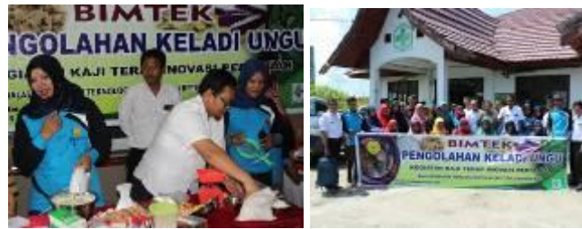
Gambar 41. Bimtek pengolahan keladi ungu

Display inovasi pertanian di Kabupaten Kampar bertujuan untuk mendiseminasikan teknologi hasil pengkajian BPTP Riau. Kegiatan display inovasi pertanian dilaksanakan di BPP Kuok, Kabupaten Kampar. Beberapa teknologi yang didiseminasikan adalah 1). display budidaya kedelai, pepaya merah delima balitbangtan, jeruk siam Kampar, Largo Super, 2). Ex-banner teknologi Jarwo Super dan Kalender Tanam (Katam), 3). buku saku deskripsi VUB, Jarwo Super, Permasalahan hama penyakit dan hara pada tanaman, 4). Juknis dan leaflet.