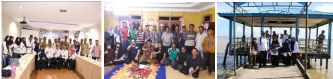
Gambar 32. Kegiatan perbatasan di Kepulauan Meranti

Dengan demikian hasil identifikasi potensi dan permasalahan pertanian terdapat beberapa komoditas pertanian yang telah diusahakan petani potensial sebagai komoditas ekspor yaitu kelapa, karet, kopi, sagu, dan padi organik yang memiliki prospek untuk dikembangkan sebagai komoditas ekspor.