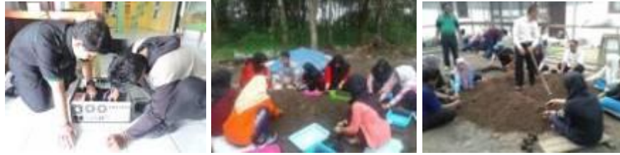
Gambar 2. Kegiatan magang siswa SMK di BPTP Riau