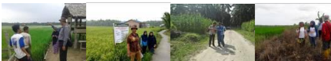
Gambar 9. Tim monev saat monitoring kegiatan di lapangan