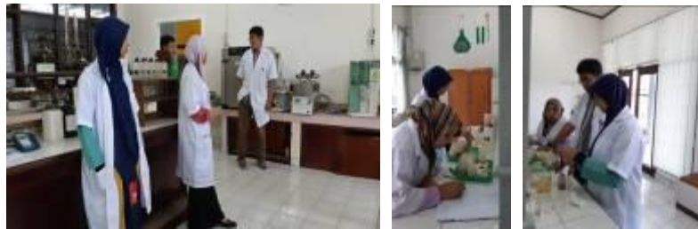
Gambar 10. Aktifitas di Laboratorium BPTP Riau