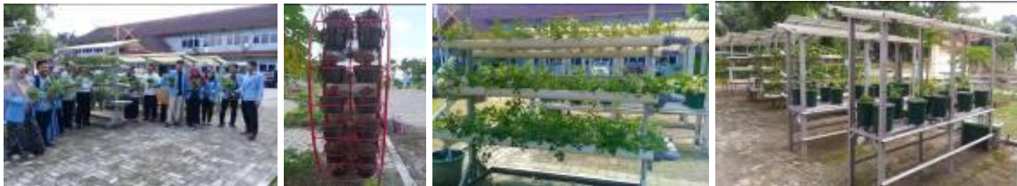
Gambar 22. Kegiatan tagrimart BPTP Riau

Kendala yang masih dihadapi untuk menjadikan Agrimart sebagai wadah/tempat kegiatan komersial adalah belum punya ruang khusus untuk komersialisasi dan jenis produk masih terbatas baru sebatas penjualan hasil dari tagrimart seperti sayur-sayuran hidroponik.