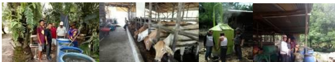
Gambar 29. Kegiatan bioindustri di Kabupaten Kampar

Kegiatan diawali dengan pelaksanaan sosialisasi setelah itu baru dilakukan pembuatan/produksi pakan komplit, peningkatan kualitas biogas, pembuatan mikroorganisme lokal, pembuatan pupuk organik cair dan padat, pembuatan Urea Molases Blok (UMB) dan pembuatan asap cair dari tankos.