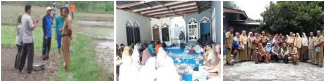
Gambar 37. Kegiatan peningkatan kapasitas penyuluh daerah