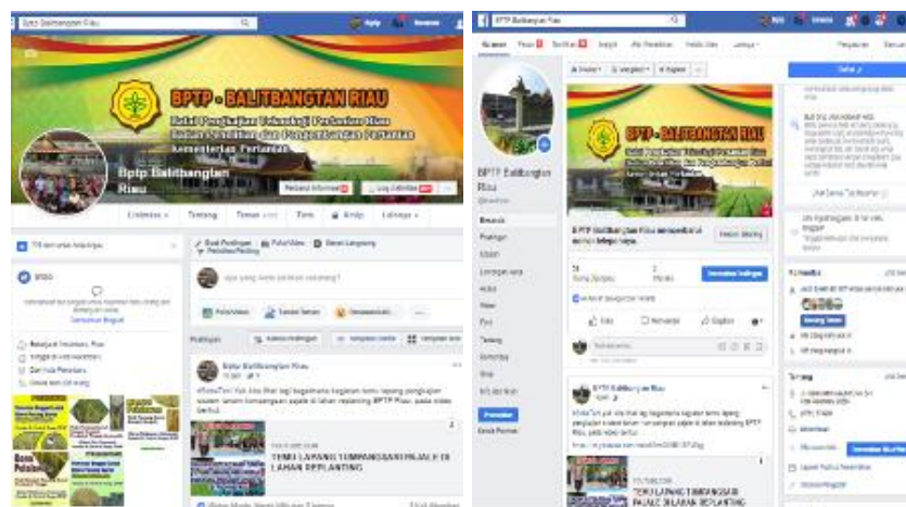
Gambar 12. Tampilan Facebook dan Fanpage BPTP Riau

Selain website BPTP Riau juga aktif mendiseminasikan inovasi teknologi melalui Facebook, pada tahun 2018 jumlah friends di FB BPTP Riau sebanyak 4.053 orang dan di halaman/Fanpage FB total pengikut sebanyak 955 orang. Tampilan FB dan Fanpage BPTP Riau seperti gambar di bawah ini.