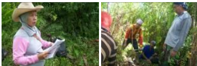
Gambar 8. Dokumentasi kegiatan survei kesesuaian lahan

Kerjasama BPTP Riau dengan pihak swasta dilaksanakan bersama PT. Uniseraya untuk kegiatan survei kesesuaian lahan yang bertujuan mengevaluasi kesesuaian lahan untuk komoditas pertanian (tanaman pangan, hortikultura, dan perkebunan) yang akan dikembangkan oleh PT. Uniseraya. Kegiatan dilaksanakan pada lahan PT. Uniseraya yang terletak di Desa Teluk Lanus dan Desa Penyengat, Kecamatan Sungai Apit, Kabupaten Siak, Provinsi Riau.