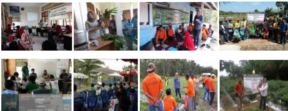
Gambar 21. Kegiatan PKAH di Kabupaten Kampar dan Siak

Kendala lainnya untuk komoditas bawang merah adalah kurangnya penguasaan teknologi budidaya TSS oleh petani dan waktu yang dibutuhkan lebih lama serta varietas TSS yang tersedia kurang diminati oleh petani. Kendala untuk komoditas jeruk adalah kurangnya Blok Pondasi Mata Tempel (BPMT), menyebabkan petani penangkar menggunakan mata tempel asalan untuk produksi benih mereka.