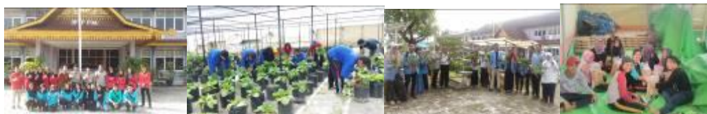
Gambar 1. Mahasiswa magang di BPTP Riau

Kerjasama BPTP Riau dengan Perguruan Tinggi antara lain dengan Universitas Riau (UR), Universitas Islam Riau, Universitas Islam Negeri Sultan Syarif Qasim. Kerjasama dengan perguruan tinggi ini berupa bimbingan kepada mahasiswa magang yang dilaksanakan di BPTP Riau, Kebun Percobaan (KP) dan di lokasi Taman Teknologi Pertanian (TTP) Siak. Jumlah mahasiswa magang dari Universitas Riau (UR) 12 orang, Universitas Islam Riau (UIR) 27 orang, Universitas Islam Negeri Sultan Syarif Kasim 9 orang.