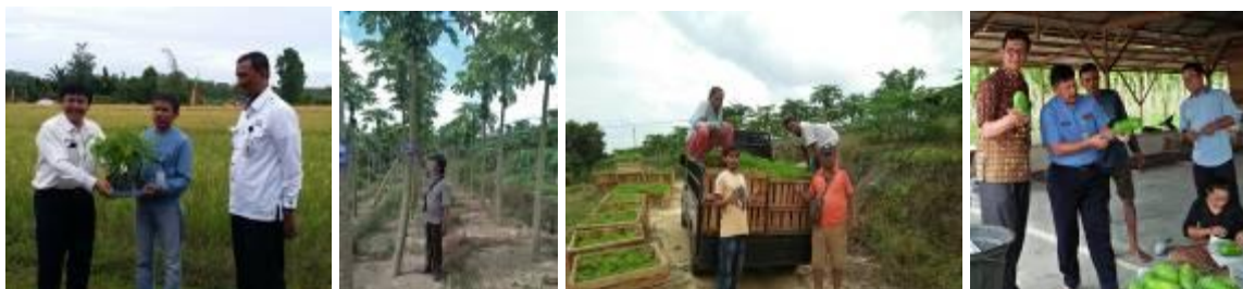
Gambar 46. Kegiatan perbenihan pepaya

Bibit pepaya yang diproduksi oleh BPTP Riau dan telah didistribusikan dengan baik ke beberapa kabupaten/kota sebanyak 15.780 batang. Untuk Kabupaten Kampar 4.000 batang yang terdistribusi di Kecamatan Kampar Utara, Tapung, dan Bangkinang Kota. Untuk Kabupaten Siak sebanyak 5.780 batang bibit yang terdistribusi di Kecamatan Siak, Dayun, Kerinci Kanan dan Kecamatan Sabak Auh. Kabupaten Rokan Hulu sebanyak 1.750 batang untuk Kecamatan Rambah Hilir. Kabupaten Indragiri Hilir 200 batang untuk Kecamatan Kempas. Kabupaten Rokan Hilir sebanyak 4.000 batang terdistribusi untuk Kecamatan Bangko dan Kecamatan Bangan Sinembah serta Kota Pekanbaru sebanyak 50 batang.