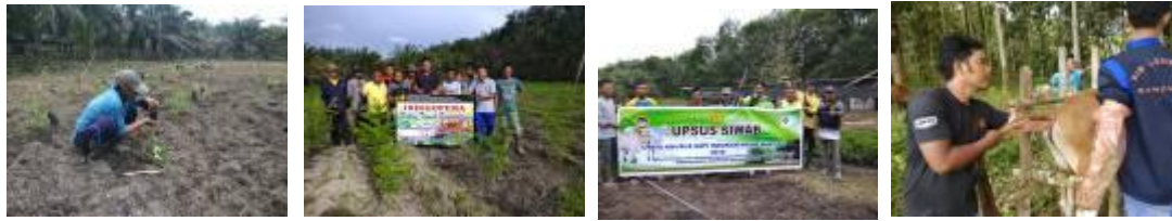
Gambar 24. Kegiatan pendampingan Upsus Siwab di Kab. Kampar dan Kuansing