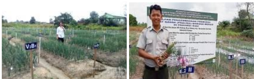
Gambar 15. Kegiatan Proliga Bawang Merah di Lahan Kering Dataran Rendah

Mulsa yang diuji mempengaruhi jumlah umbi per rumpun tanaman sedangkan ZPT organik yang diuji tidak mempengaruhi jumlah umbi yang dihasilkan. Interaksi keduanya juga tidak mempengaruhi jumlah umbi yang dihasilkan. Jumlah umbi terbanyak dihasilkan pada tanaman yang menggunakan mulsa perak/grenjeng (1.87). Perlakuan yang diuji tidak mempengaruhi berat umbi yang dihasilkan baik itu secara tunggal maupun interaksi.