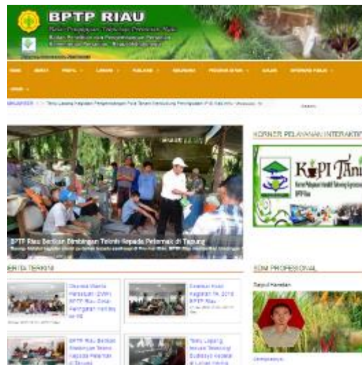
Gambar 11. Tampilan Website BPTP Riau

Selain website BPTP Riau juga aktif mendiseminasikan inovasi teknologi melalui Facebook, pada tahun 2018 jumlah friends di FB BPTP Riau sebanyak 4.053 orang dan di halaman/Fanpage FB total pengikut sebanyak 955 orang. Tampilan FB dan Fanpage BPTP Riau seperti gambar di bawah ini.