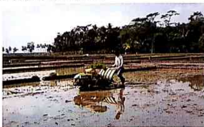
Gambar 4. Penanaman menggunakan Indojarwo transplanter

Penanaman dapat menggunakan mesin tanam Indojarwo transplanter atau secara manual. Kondisi air pada saat tanam macak-macak untuk menghindari selip roda dan memudahkan pelepasan bibit dari alat tanam. Jika diperlukan, populasi tanaman dapat disesuaikan dengan cara mengatur jarak tanam dalam barisan dan jarak antar legowo.