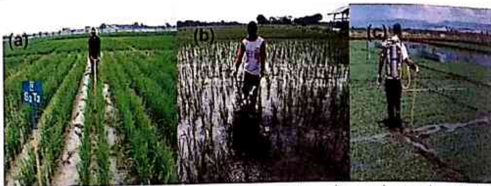
Gambar 6. Pengendalian gulma menggunakan a) gasrok atau landak, b) power weeder, dan c) herbisida selektif

Aplikasi herbisida selektif digunakan untuk pengendalian gulma jenis tertentu. Herbisida yang digunakan di lokasi Demarea adalah jenis herbisida pratumbuh berbahan aktif pendimethalin dan metil metsulfuron.