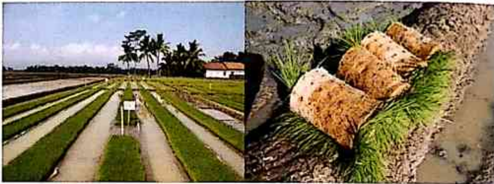
Gambar 3. Persemaian dengan sistem dapog

terdiri atas campuran tanah dan pupuk kandang dengan perbandingan 3:2.