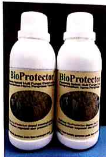
Gambar 7. Pestisida nabati BioProtector

Bahan aktif pestisida nabati yang diaplikasikan ke pertanaman beberapa waktu kemudian akan terurai terutama