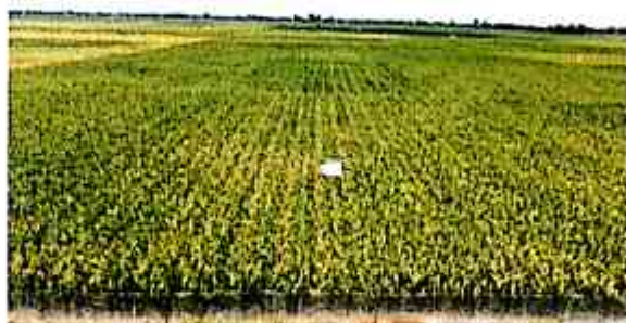
Gambar 1. Padi yang ditanam dengan sistem jajar legowo super