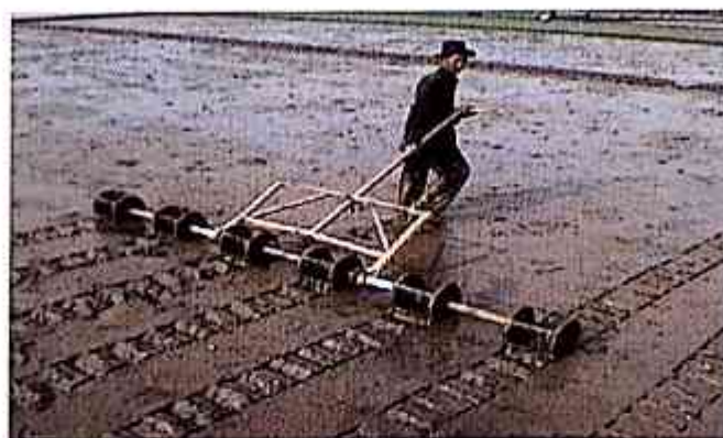
Gambar 5. Pembuatan tanda jarak tanam menggunakan caplak

Penanaman secara manual dilakukan dengan bantuan caplak. Pencaplukan dilakukan untuk membuat "tanda" jarak tanam yang seragam dan teratur. Ukuran caplak menentukan jarak tanam dan populasi tanaman per satuan luas. Jarak antar