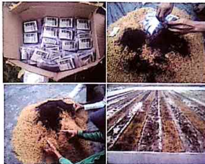
Gambar 2. Aplikasi pupuk hayati pada benih padi

Benih yang telah tercampur pupuk hayati segera disemai, upayakan tidak ditunda lebih dari 3 jam, dan tidak terkena paparan sinar matahari agar tidak mematikan mikroba yang telah melekat pada benih. Sisa pupuk hayati disebar di lahan persemaian.