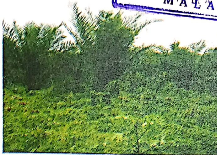
Gambar 3. Tumpang sari kelapa sawit dengan ubi kayu