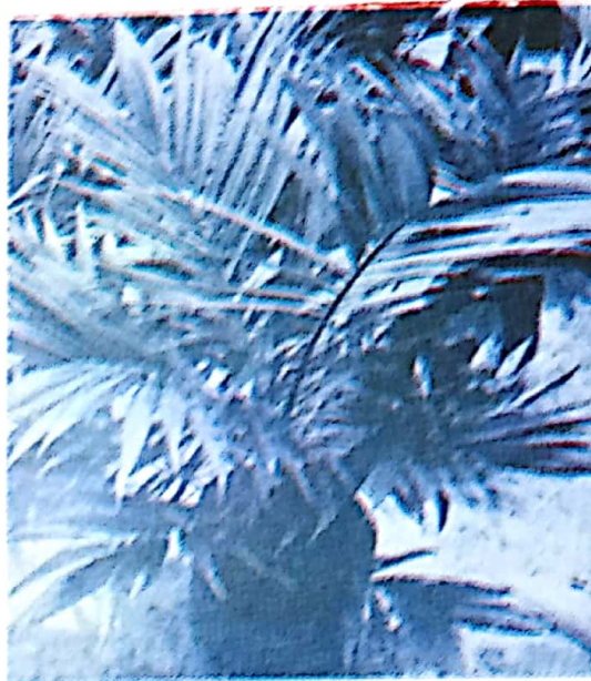
Gambar 2. Bibit kelapa sawit siap dipindahkan ke lapangan

pada umur 10-14 bulan. Pemindahan bibit ke lapangan harus diusahakan agar bibit tidak rusak dan polybagnya tidak pecah.