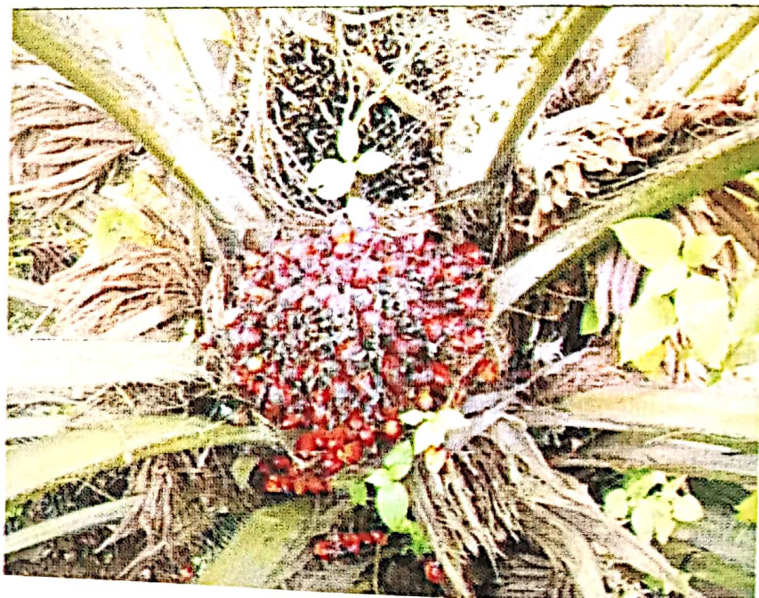
Gambar 5. Tandan buah yang siap panen

Ciri tandan matang panen adalah sedikitnya ada 5 buah yang lepas/jatuh (brondolan) dari tandan yang beratnya kurang dari 10 kg atau sedikitnya ada 10 buah yang lepas dari tandan yang beratnya 10 kg atau lebih. Disamping itu ada kriteria lain tandan buah yang dapat dipanen apabila tanaman berumur kurang dari 10 tahun, jumlah brondolan yang jatuh kurang lebih 10 butir, jika tanaman berumur lebih dari 10 tahun, serta jumlah brondolan yang jatuh sekitar 15-20 butir.