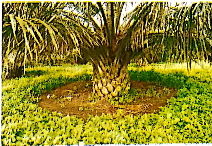
Gambar 4. Pengendalian gulma dengan cara bokoran

Piringan di sekitar tanaman kelapa sawit harus tetap bersih. Oleh karena itu tanah di sekitar pokok dengan jari-jari 1-2 m dari tanaman harus selalu bersih dan gulma yang tumbuh harus dibabat, atau disemprot dengan herbisida.