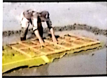
Gambar 3. Cara Pesemaian modifikasi dapok