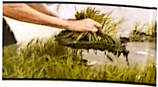
Gambar 6. Pencabutan bibit

(6) Pada umur 5 hari penutup pesemaian dibuka. Aplikasi pupuk urea di pesemaian pada umur 7 hari setelah sebar dengan dosis 40 g/m 2 .