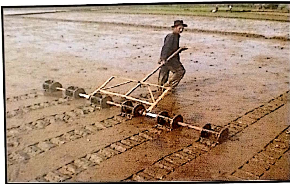
Gambar 9. Pencaplakan untuk membuat tanda jarak tanam

Pencaplakan untuk membuat "tanda" jarak tanam bibit secara seragam dan teratur (Gambar 9). Ukuran caplak menentukan jarak tanam dan populasi rumpun tanaman per satuan luas. Pada lahan yang selalu tergenang ketika saat tanam seperti dilahan dengan drainase buruk dan lebak ataupun pasang surut yang kondiri airnya relatif masih tinggi pencaplakan sulit dilakukan.