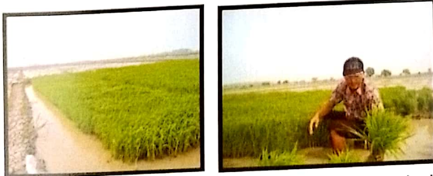
Gambar 8. Bibit umur 25-30 hari

Bibit ditanam pada umur 25-30 hari, bibit yang kurang sehat tidak digunakan. Pencabutan bibit dengan cara ombol atau banyak, sehingga mengurangi rusaknya akar. Bibit yang telah dicabut kemudian diikat, untuk memudahkan pengangkutan dan distribusi ke petakan. Tidak dianjurkan menanam bibit yang tidak jelas varietasnya, berasal dari penjual bibit siap tanam.