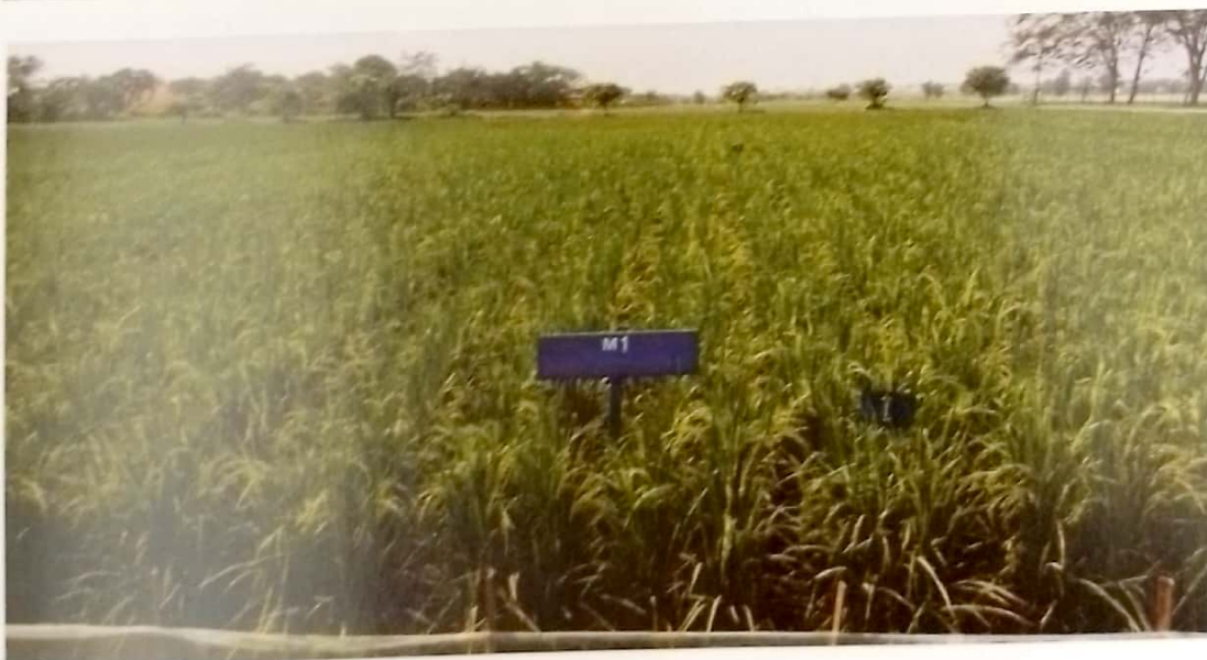
Gambar 1. Keragaan tanaman Inpari 31 pada teknologi budidaya Hazton saat berumur 87 Hari Setelah Sebar (HSS)