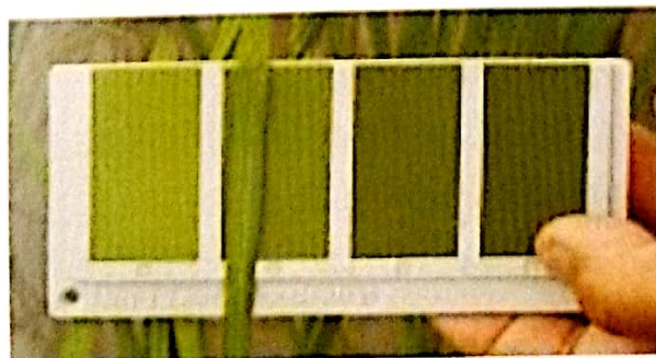
Gambar 12. Alat penetapan kebutuhan pupuk N pada tanaman padi (BWD) (Dok. Koleksi BB Padi, 2010)

Pupuk susulan diberikan pada fase kritis pertumbuhan tanaman atau pada stadia primordia bunga (15-30 HST), tergantung varietas yang ditanam. Dosis dan waktu pemberian pupuk N susulan didasarkan pada hasil pembacaan Bagan Warna Daun (BWD) (Gambar 12) yang dimulai dari 2 minggu setelah tanam dan diulangi dengan interval pembacaan setiap minggu. Apabila terjadi gejala kahat kalium berikan pupuk kalium dengan dosis 20 kg K 2 O per hektar, hal ini dapat meningkatkan ketahanan terhadap penyakit.