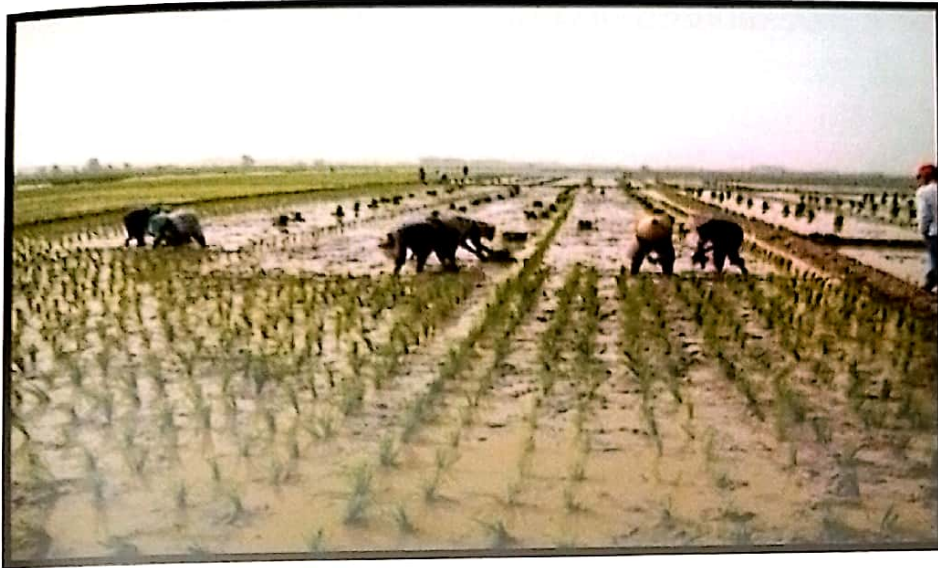
Gambar 10. Penanaman 20-30 bibit/lubang tanam

Penanaman dilakukan dengan umur bibit 25-30 hari setelah semai. Tujuannya agar tidak ada anakan yang banyak. Seluruhnya tanaman induk sehingga lebih cepat masak sekitar 10 hari. Penggunaan bibit tua juga cocok untuk daerah endemis hama keong mas.