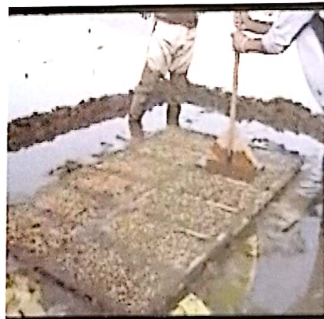
Gambar 5. Penaburan benih