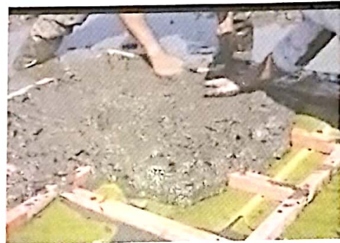
Gambar 4. Pengisian media dapok