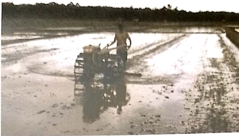
Gambar 7. Pengolahan lahan untuk teknologi budidaya Hazton