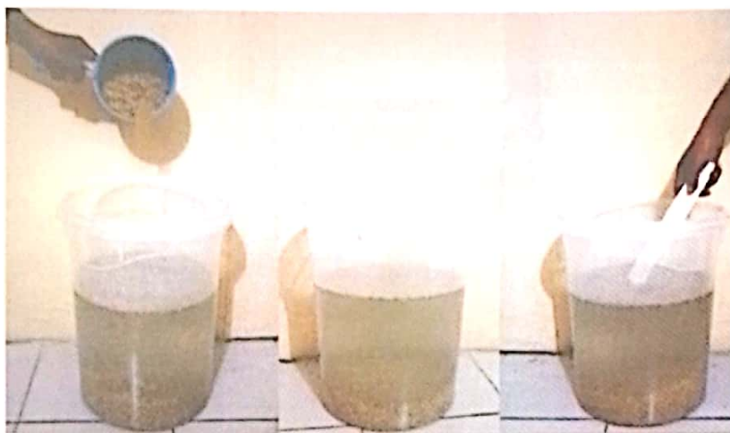
Gambar 2. Pemisahan benih padi bernas dan hampa dengan larutan garam

Apabila menggunakan air, pertama benih dimasukkan ke dalam tempat yang berisi air, volume air 2 kali volume benih, kemudian diaduk-aduk. Benih yang terapung dipisahkan dengan benih yang tenggelam. Benih yang tenggelam berarti bernas, baik untuk pesemaian. Sebelum semai, benih direndam selama 24 jam dan diperam satu malam.