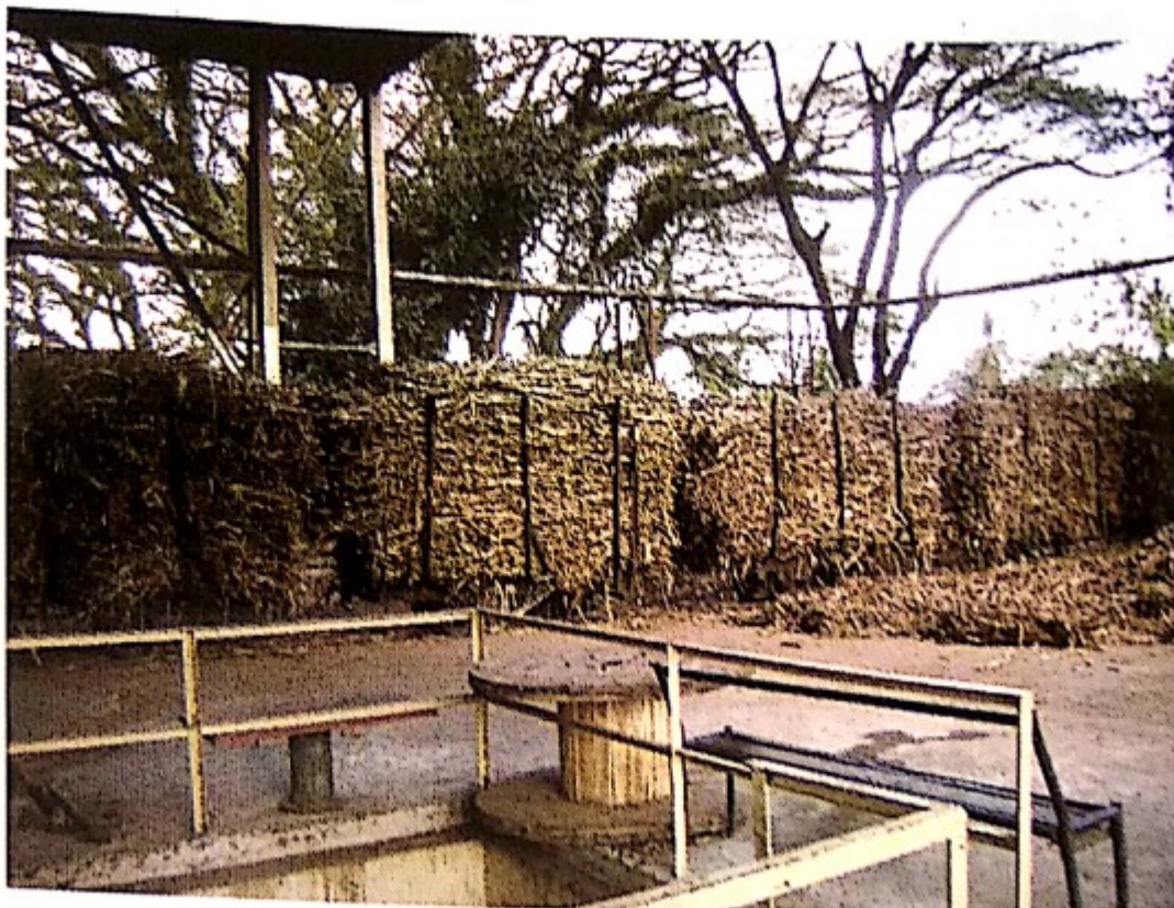
Tebu siap digiling

Pada penebangan tebu dengan teknik chopped cane , penebangan tebu dilakukan dengan memakai mesin pemanen tebu ( cane harvester ). Hasil penebangan tebu dengan teknik ini berupa potongan tebu dengan panjang 20-30 cm. Teknik ini dapat dilakukan pada lahan tebu yang bersih dari sisa tunggul, tidak banyak gulma, tanah dalam keadaan kering, kondisi tebu tidak banyak roboh dan petak tebang dalam kondisi utuh sekitar 8 ha.