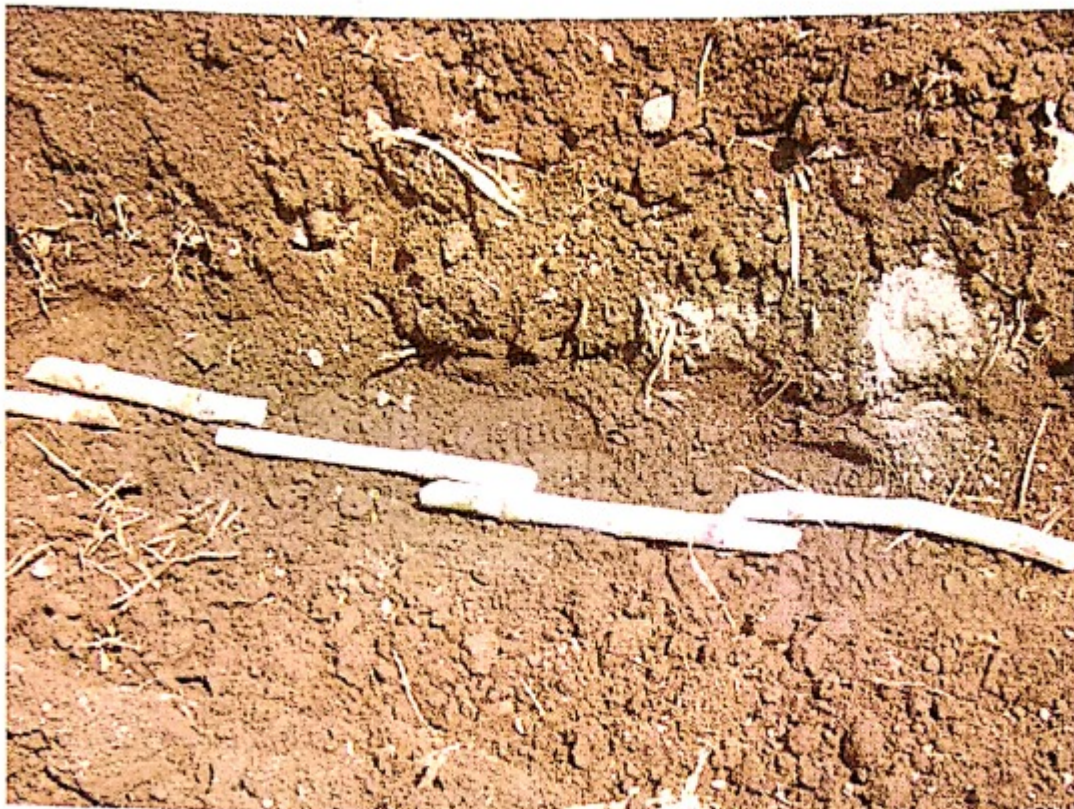
Penanaman bibit secara over lapping