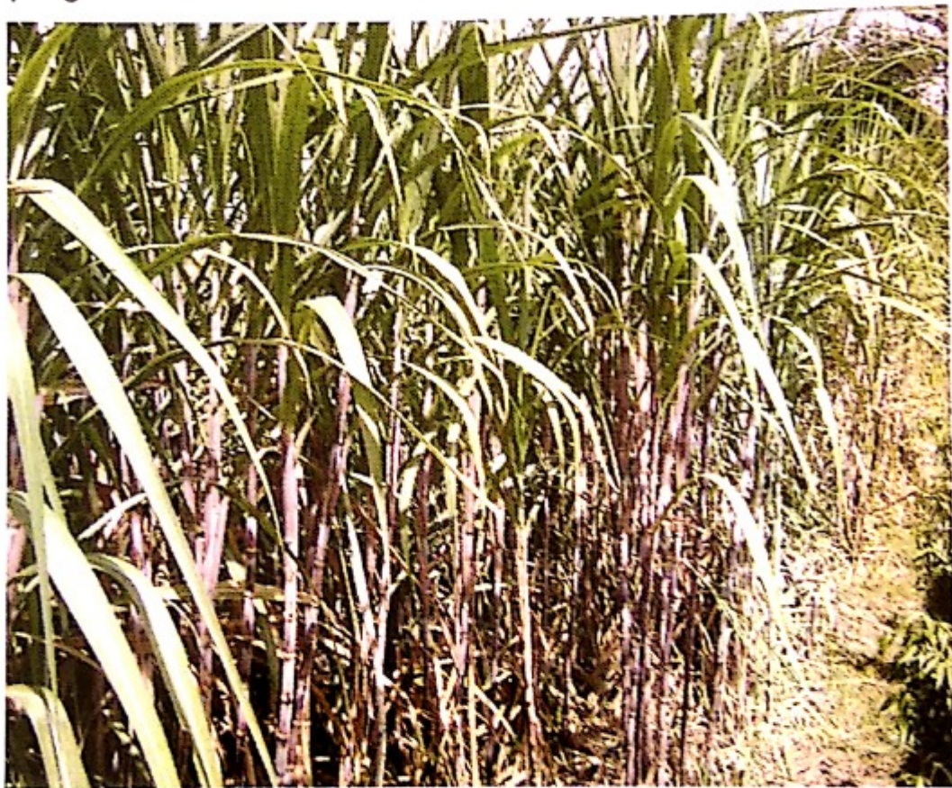
Penampilan tanaman tebu

Masalah lain yang berakibat pada rendahnya efisiensi industri gula nasional adalah kondisi varietas tebu yang dipakai menunjukkan komposisi kemasakan yang tidak seimbang antara masak awal, masak tengah dan masak akhir, hal ini berdampak pada masa giling yang berkepanjangan dan banyaknya tebu masak lambat yang ditebang dan diolah pada masa awal sehingga rendemen menjadi rendah. Penerapan teknologi budidaya tebu juga belum dilaksanakan secara optimal dan banyak tanaman tebu dengan ratun lebih dari 3 kali. Oleh sebab itu dalam buku ini akan disajikan teknologi yang telah dihasilkan mulai dari hulu sampai hilir.