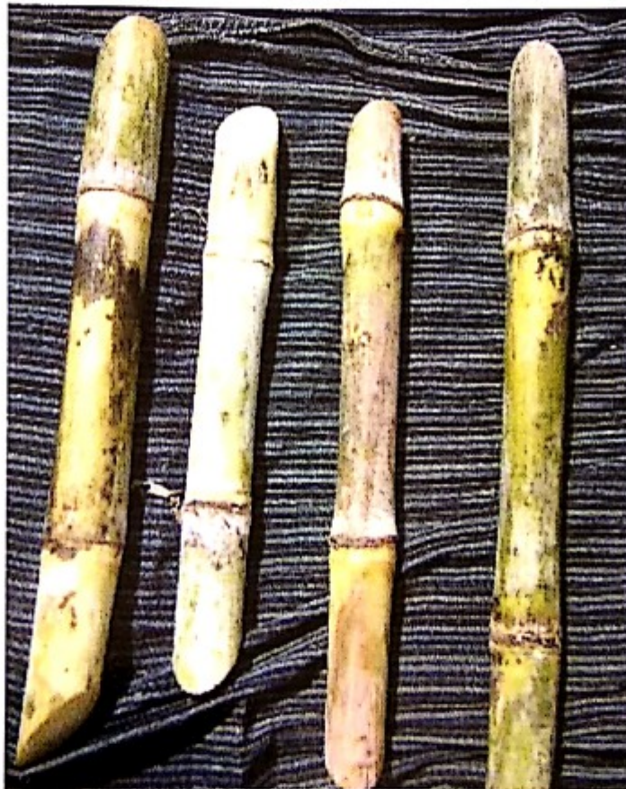
Bibit stek batang/bagal dua mata tunas