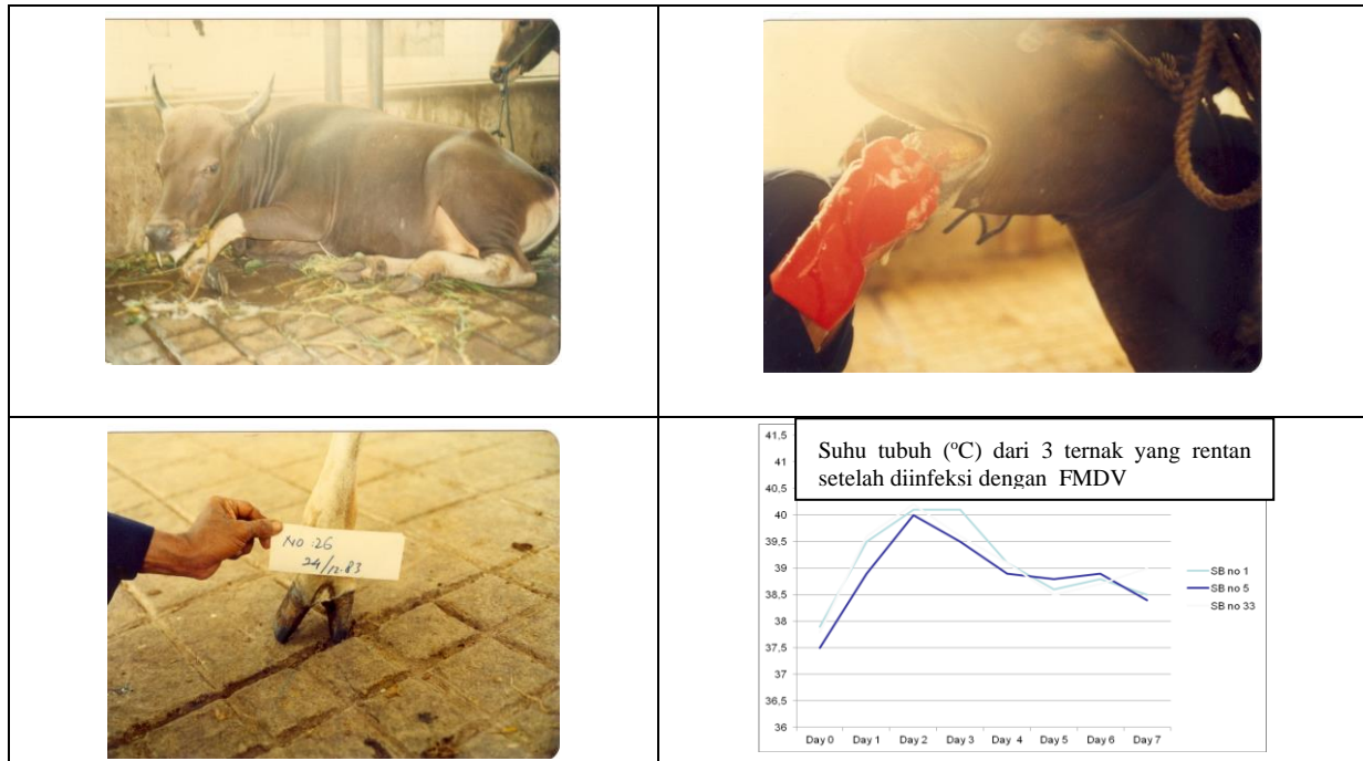
Gambar 1. Gejala klinis PMK pada sapi Bali yang diinfeksi dengan virus PMK Ojava83